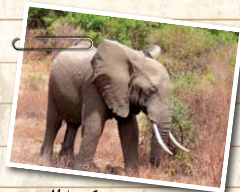
Afrika - Serengeti-Safari