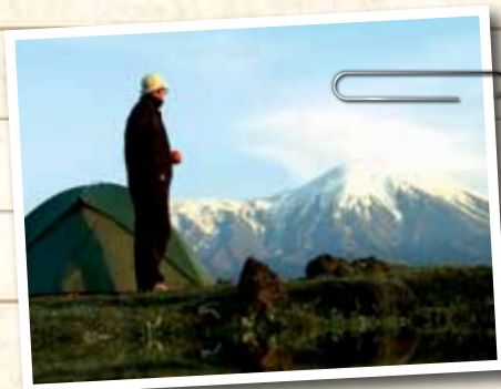
Frankreich - Gebirgsmassiv