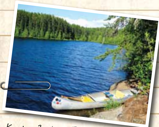
Kanada - 4 Wochen Frieden und Ruhe!

Wohin auch immer Ihr nächstes Abenteuer Sie führt, Transcend wird dabei sein.